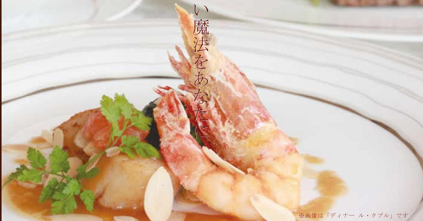
※画像は「ディナー ル・カップル」です